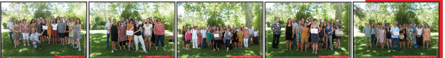
Campus de Perpignan (CRD) et de Montpellier (amphi), Photos d'équipes (IATS, IFOCAS, IRTS Montpellier, IRTS Perpignan, services transversaux, en juillet 2019)