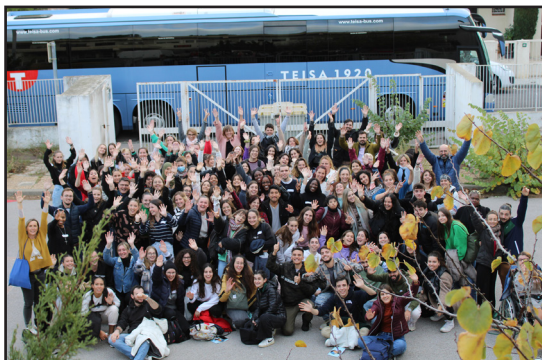
23 mars 2023 : les étudiants ASS, EJE et ES (1ère année, IRTS Perpignan) de retour d'une journée transfrontalière à l'Université de Gérone (rencontre et travaux avec les étudiants catalans).

Propos recueillis par mail le 20/08/2023 par Fred Roca.